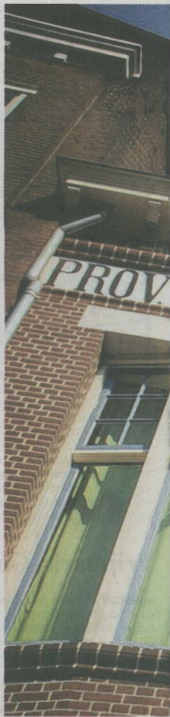
De Grote Broek, het pand is na