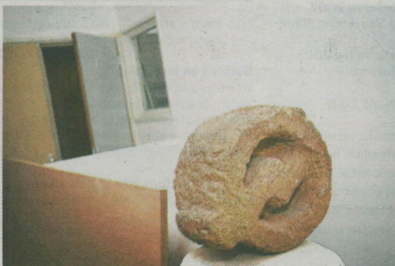
Het markante kraaksymbool als kunstwerk bij de ingang naar de Onderbroek.