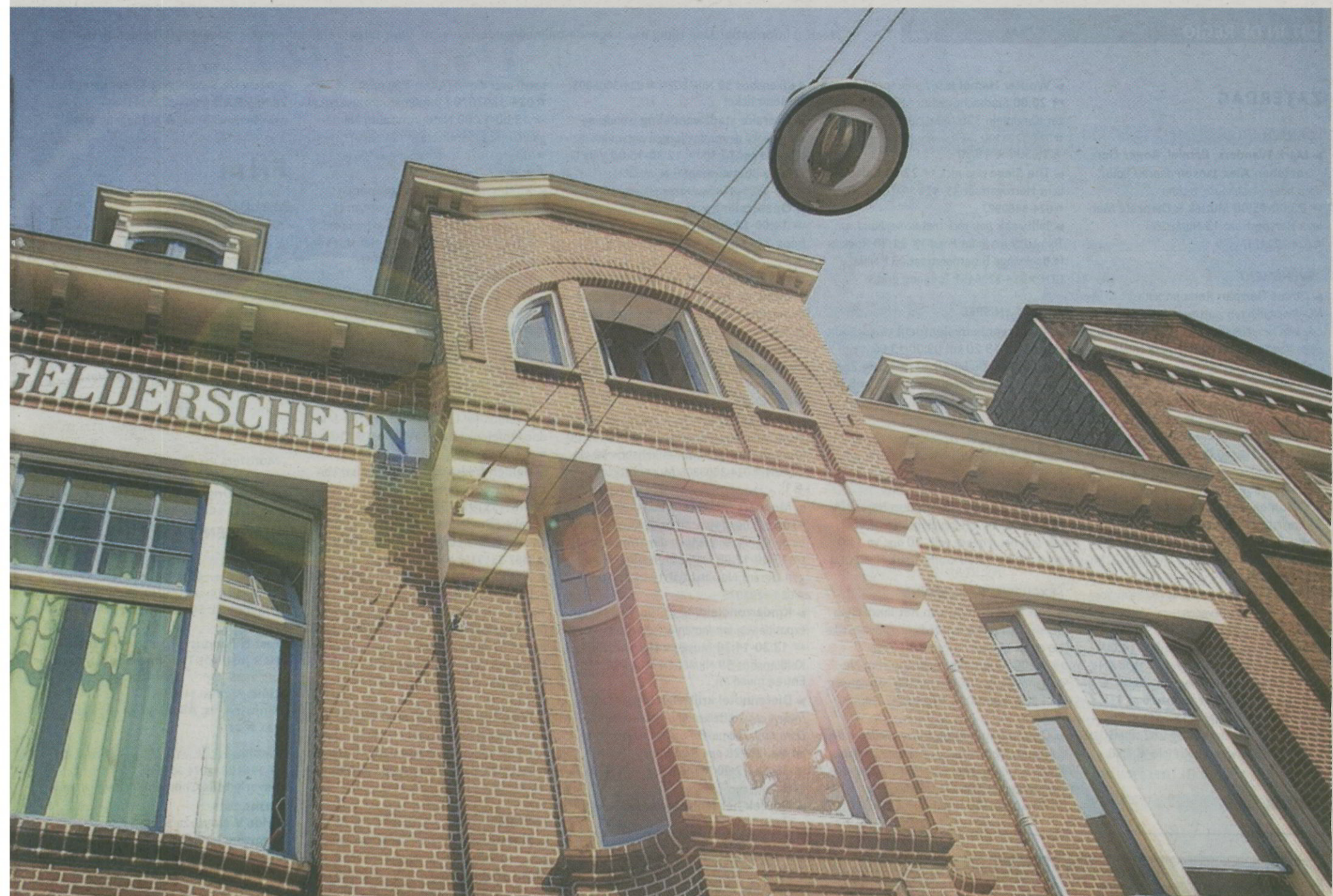
erbouwing nog mooier en publieksvriendelijk geworden.