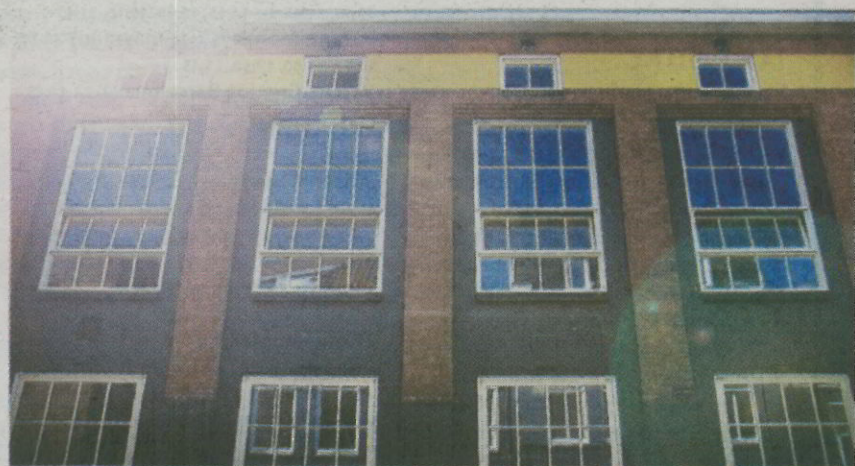
De achterkant van het pand heeft een opener karakter gekregen