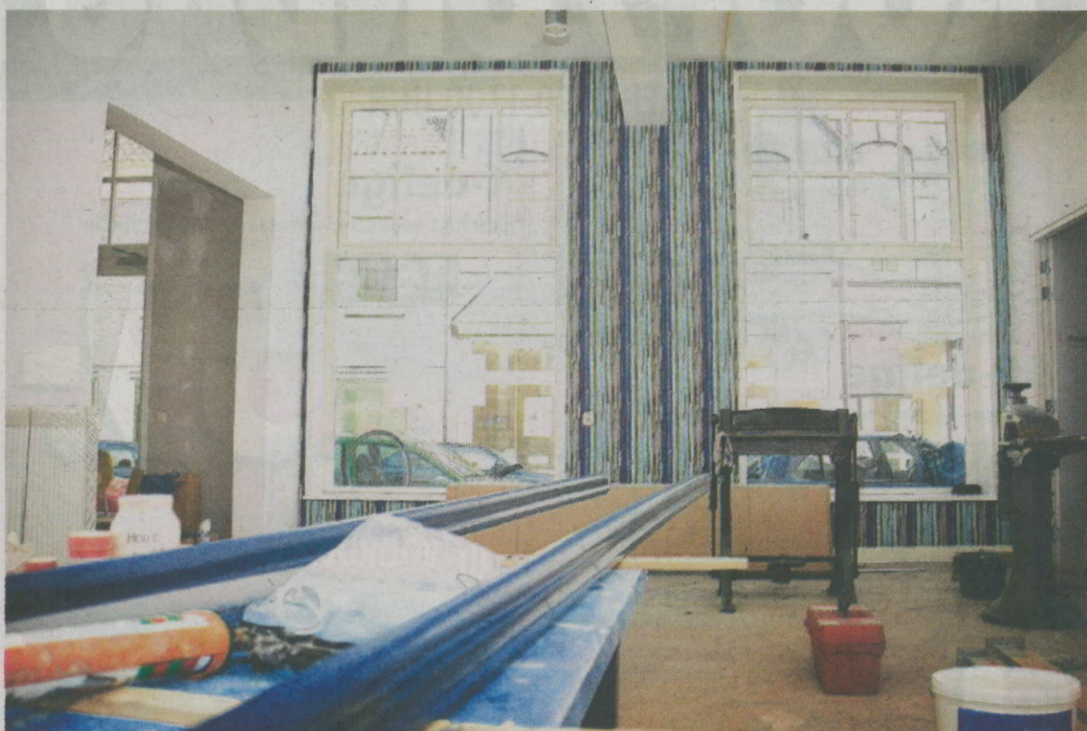
De drukkerij van subcultuurhuis Extrapool zal worden gehuisvest in de oude krantendrukkerij van de Geldersche Courant en Nijmeegsche Courant